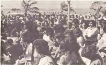
Un multitud grandisimo di alumnonan di school y publico tabata presente ariba 18 di Maart mainta dilanti Besuurskantoor.